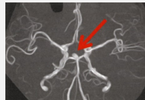
未破裂脳動脈瘤のMRA画像

血管の画像を立体的に画像化し、未破裂脳動脈瘤や脳動脈の狭窄などの異常を発見することができます。