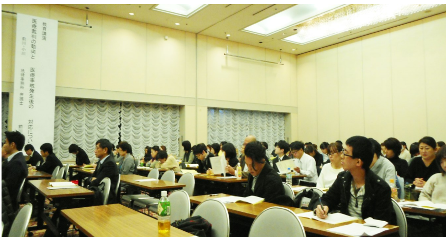
↑ 合同研修会の様子 ↑