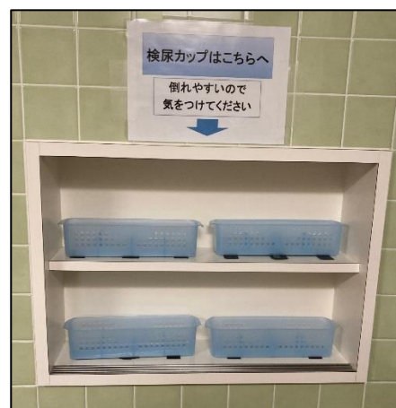
トイレ:手洗い場の後ろ